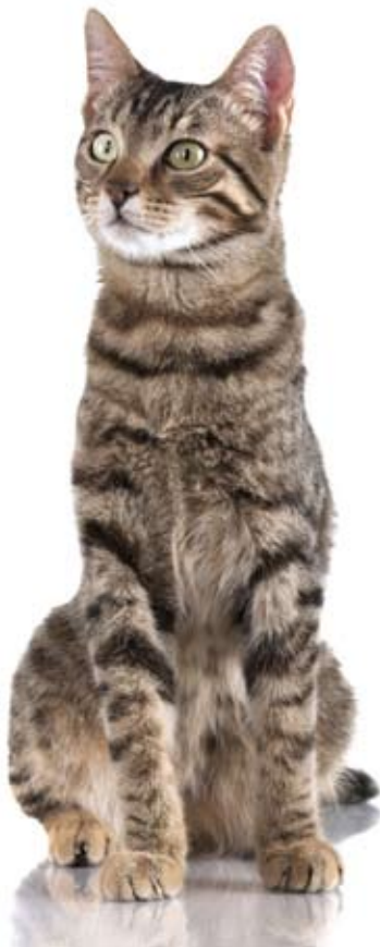
Cyprische kat, makreel

We hebben gelezen wat het verschil is tussen een lapjes en schildpad poes. Ook hebben we geleerd dat cypers een kleur is en geen ras, maar hoe ziet een cypers kat er dan uit. En zijn daar ook nog verschillende soorten in?