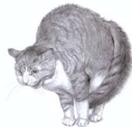
angst - agressie

Bij angst agressie heeft de kat grote pupillen, de oren zijn naar achteren op de kop gedraaid, snorharen naar voren en vaak de bek geopend door het blazen. De lichaamshouding is met een hoge rug en de vacht staat omhoog en uit. Hij heeft een dikke staart die of omhoog staat of tegen het lichaam ligt. De kat probeert zich groot te maken.