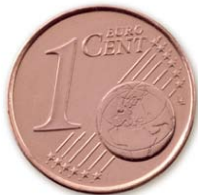
Eurocent en chip

Als u uw huisdier in de maand juni laat chippen, zijn de kosten voor het chippen en registreren bij de Nederlandse Data Bank € 25,00