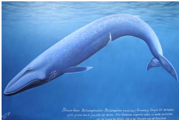
illustratie: Rob van Assen - © ArtBoutique

Zo bouwen ze een flinke speklag op, waar ze de rest van het jaar op kunnen teren. Aan het einde van de zomer trekken ze naar warmere wateren, waar de vrouwtjes eventueel een jong krijgen. Ze eten dan helemaal niets meer, maar voeden wel hun jong. In de zeven maanden durende zoogperiode kan een vrouwtje maar liefst een kwart van haar lichaamsgewicht (ongeveer 25 ton) verliezen. Haar jong weegt bij geboorte zo'n 2 ton. Een dier van een dergelijke grootte kan uitsluitend in water leven. Op het land zou het dier stikken daar het door zijn borstkas zakt en dus geen adem kan halen.